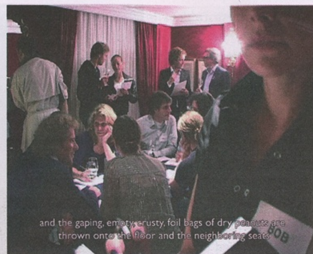
and the gaping, empty, rusty, foil bags of dry peanuts are thrown onto the floor and the neighboring seats

mp Ok, sorry, I'll talk now. I was the host, and walked around facilitating interactions, making false introductions, and punching out holes on people's behavioral scorecards like a train conductor slash drill sergeant. And tried to be a fucking curator.