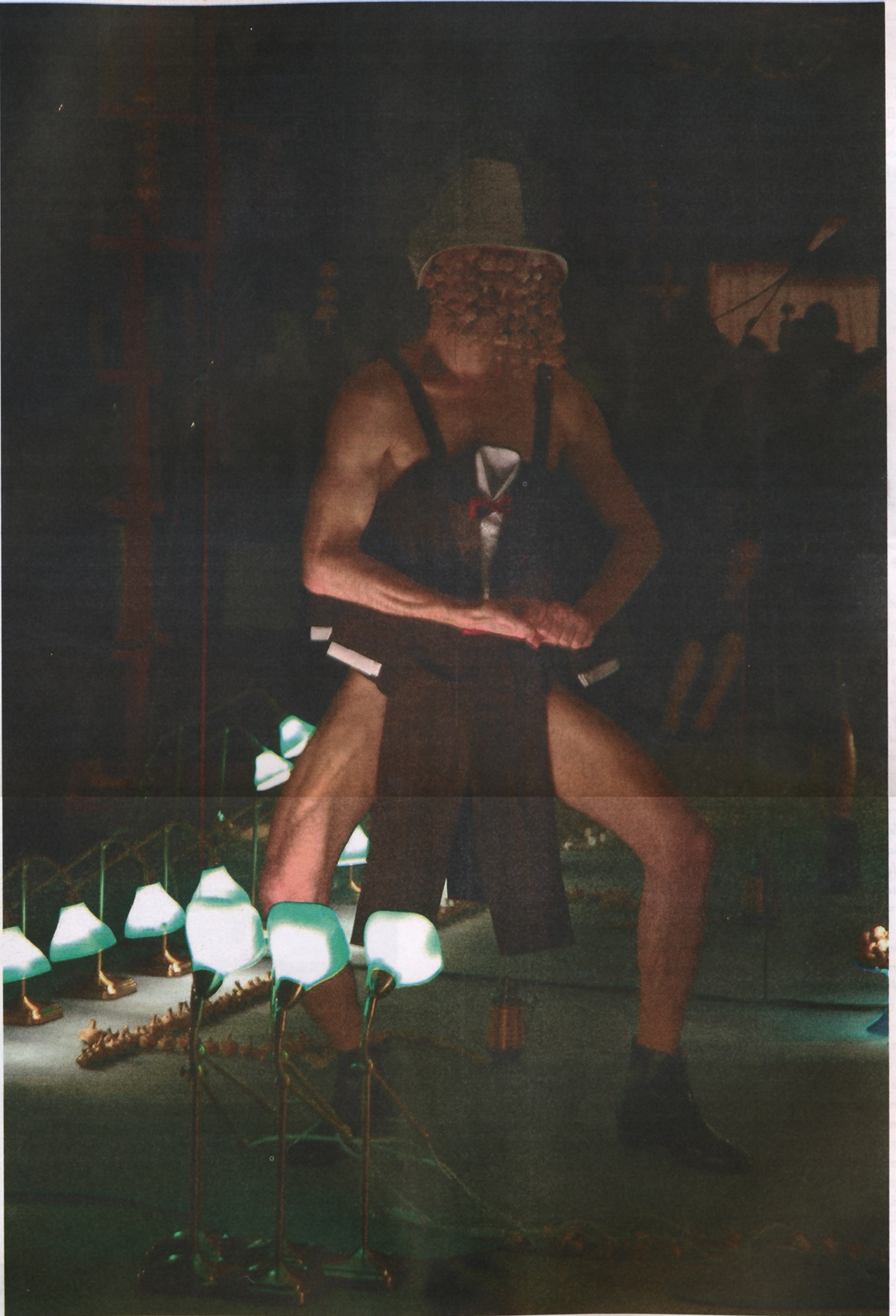
The Gutsongs of XAR , 2007.