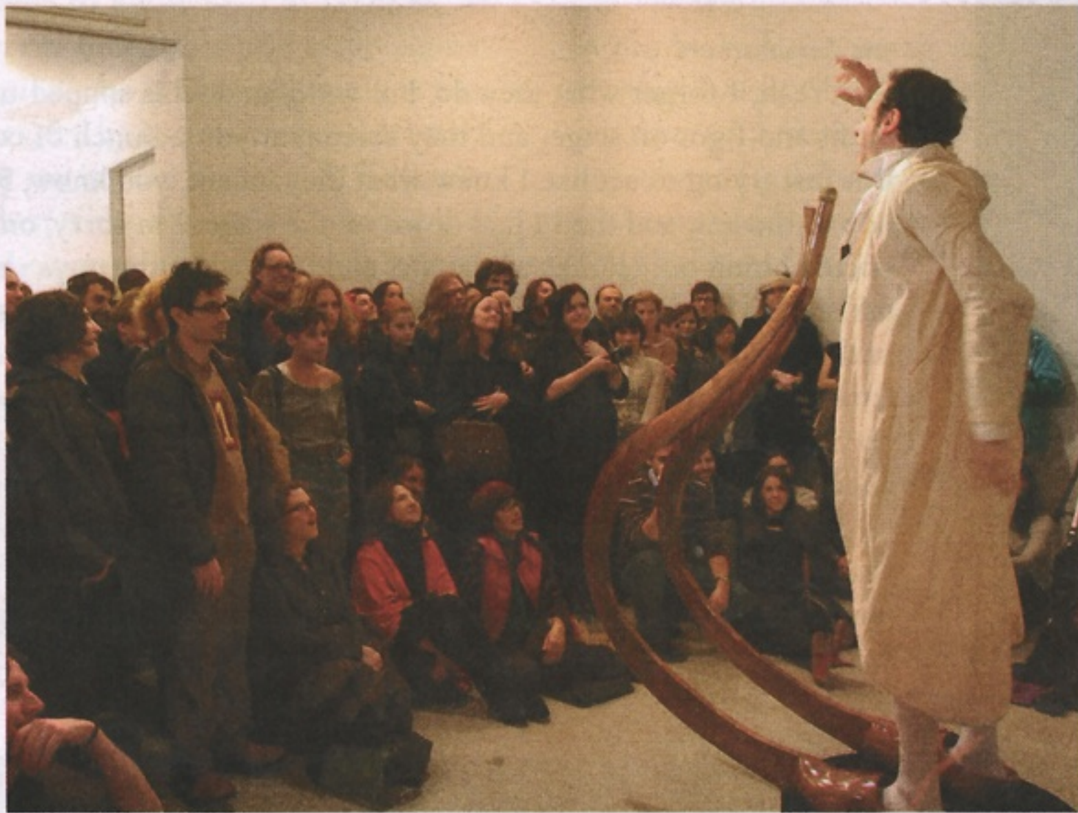
The Dudion Levers, 2009.