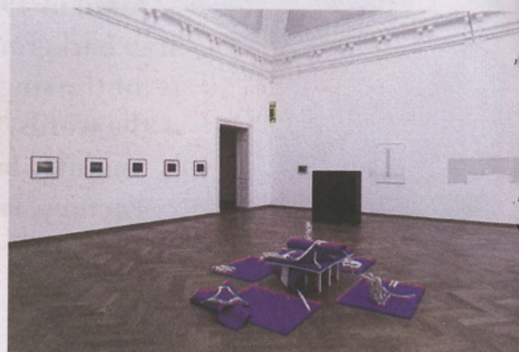
Filzzungeungewiss, 2008. Courtesy: the artist. Photo: Stefan Meier, © Kunsthalle Basel, 2008