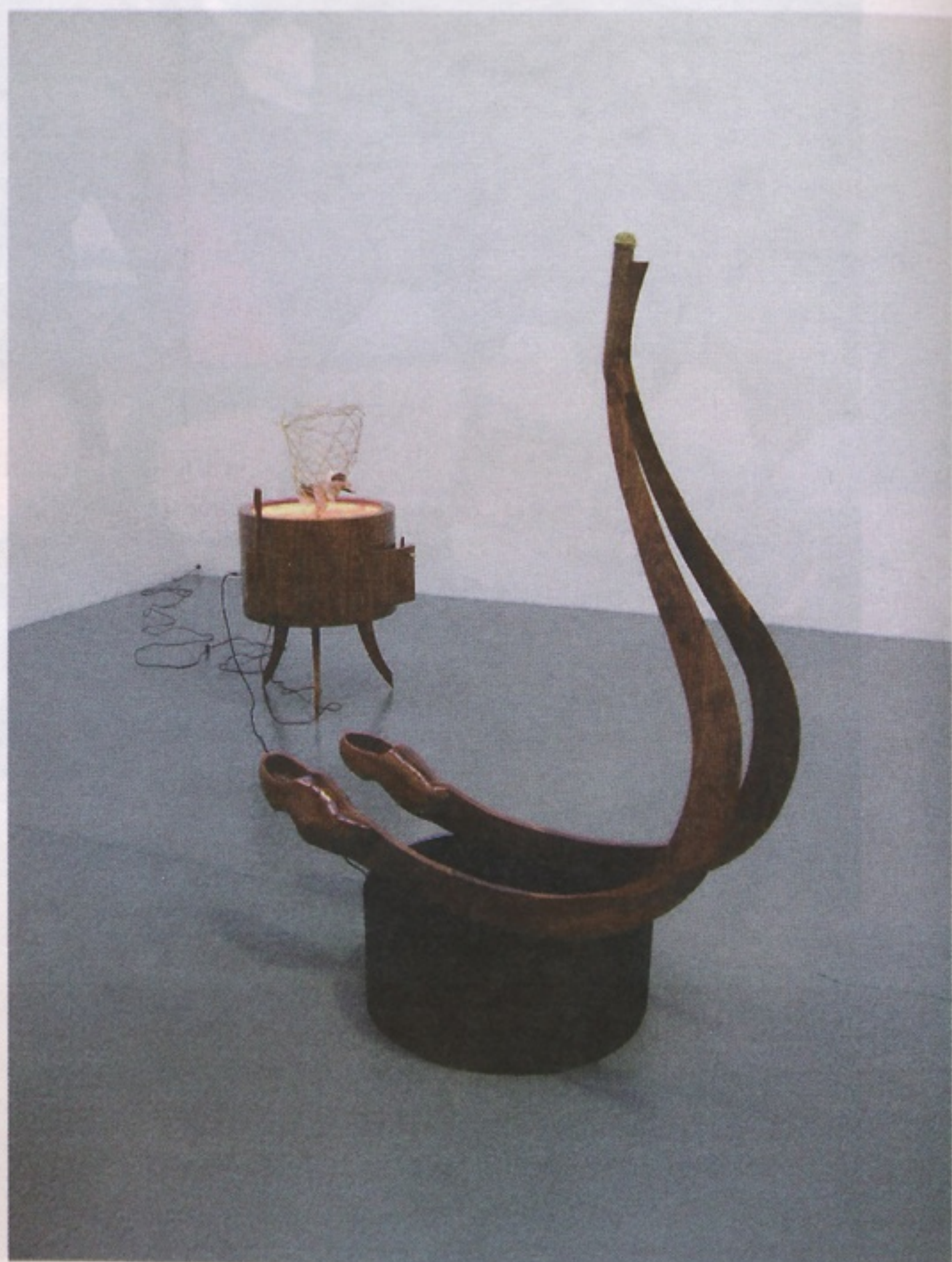
The Instrument , 2008.

mp Davvero? Oh, allora non dovrei dire che cosa è successo.