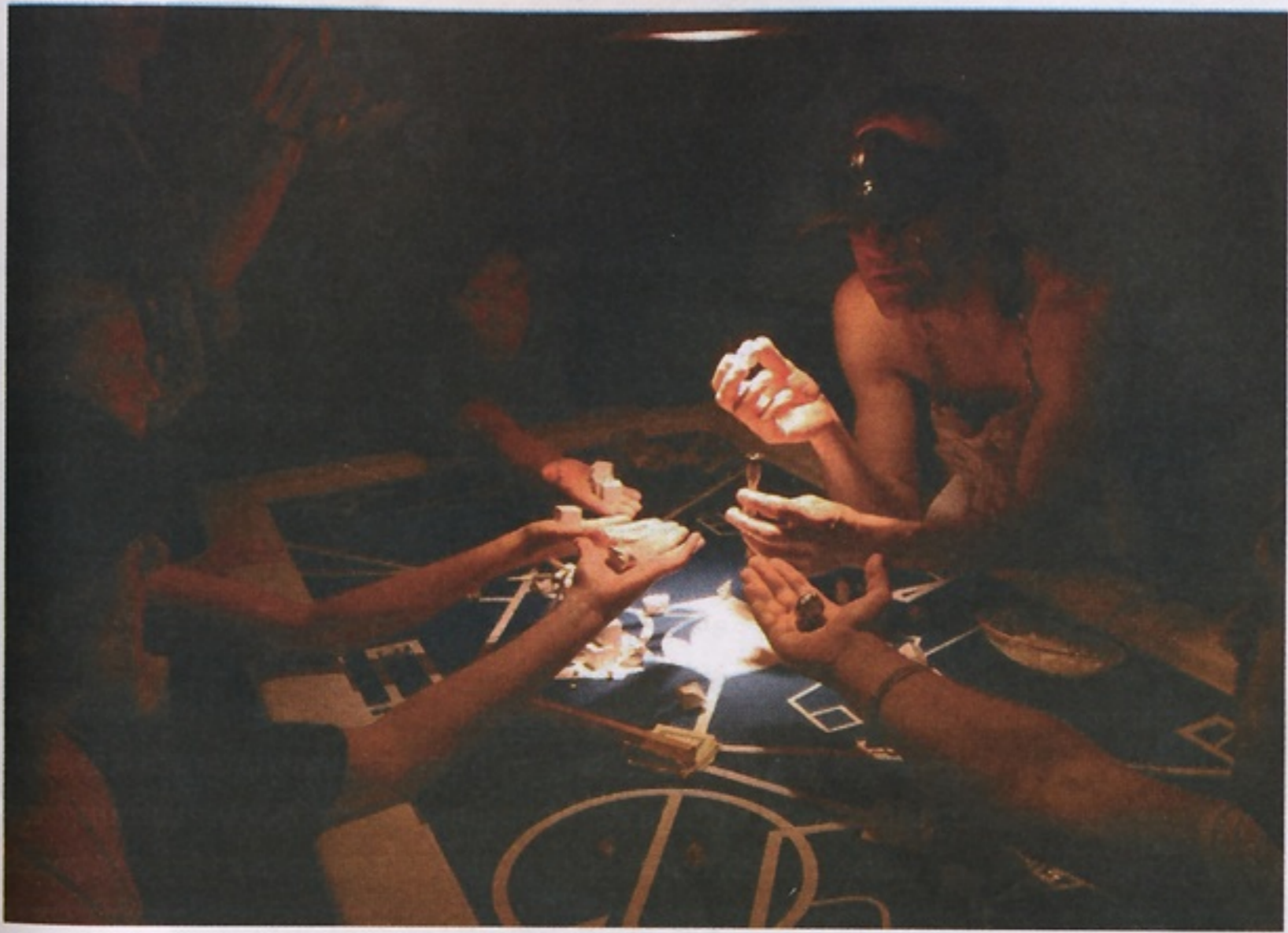
Talus , 2007.

mp They don't? Oh, then I shouldn't say what happened.