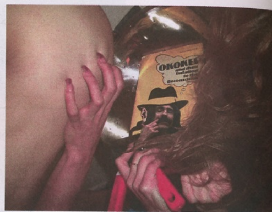
The K Sound, 2006.